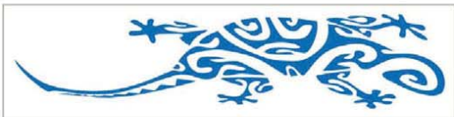
Naklejka My Hawaiian Nissan