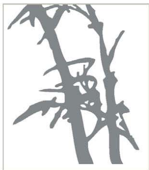
Naklejka My Green Nissan