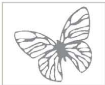
Naklejka My Lovely Nissan