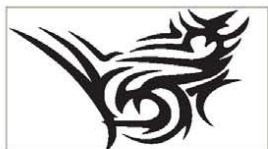
Naklejka My Tribe Nissan