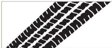
Naklejka My Nissan 4x4