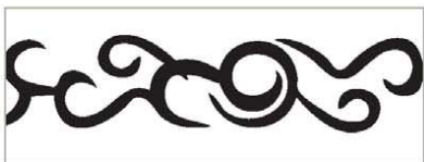
Naklejka My Tribe Nissan