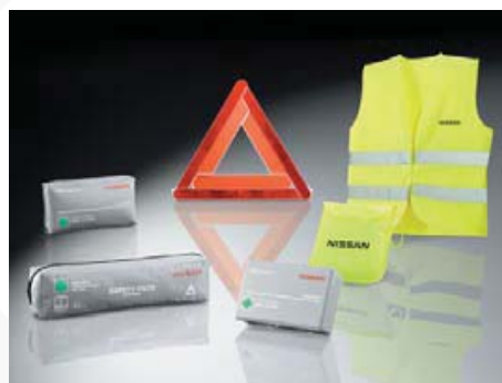
Akcesoria bezpieczeństwa (65-91)