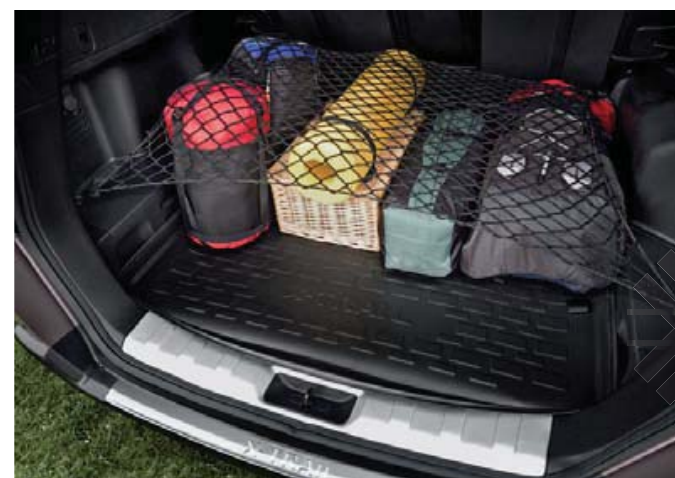
Miękka wykładzina przestrzeni bagażowej (67) . Łatwa w montażu wykładzina uzupełnia standardową warstwę ochronną bagażnika. Oferujemy również siatkę bagażnika (68) , która unieruchamia bagaż oraz Listwę stylizującą krawędzie drzwi tyłu nadwozia (30) , która chroni karoserię przed zadrapaniami powstającymi przy ładowaniu i rozładowywaniu bagaży.

Funkcjonalne akcesoria umożliwiają jak najlepsze zagospodarowanie obszernej przestrzeni bagażowej X-TRAILa. Przegroda przestrzeni bagażowej jest świetnym pomysłem na rozdzielenie obszarów bagażnika np. dla psa i bagażu, a kratka przegrody uniemożliwia przedostawanie się bagażu (lub psów) do przestrzeni dla pasażerów.