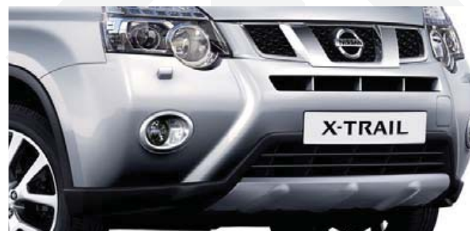
Przednia nakładka stylizująca zwiększy elegancję i solidność obszaru przedniego zderzaka.

Niech akcesoria stylizacyjne pozwolą Ci cieszyć się dodatkowymi wrażeniami estetycznymi. Spoiler dachowy zlewa się w harmonijną całość z górną częścią nadwozia wzmacniając sportowy styl auta, a nakładka stylizacyjna subtelnie podkreśla dynamikę tylnej części samochodu. Aby ułatwić sobie wsiadanie i wysiadanie zamontuj zewnętrzne stopnie boczne!