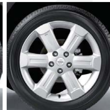
18-calowe felgi aluminiowe Sapporo (11)