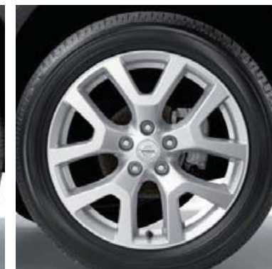
18-calowe felgi aluminiowe (10)