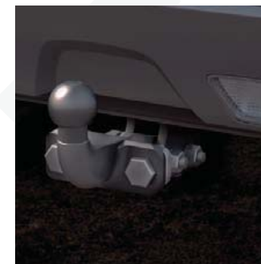
Zaczep holowniczy kołnierzowy (64) .