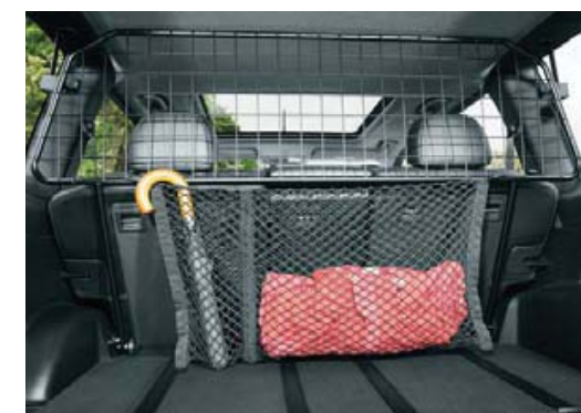
Kratka oddzielająca (64) i siatka bagażowa (69) w pionowej pozycji „łoża”.