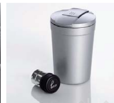
Zapałniczka i popielniczka przenośna (74-75).