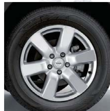
17-calowe felgi aluminiowe (09)

Nakrętki zabezpieczające (12) chroniące cenne felgi aluminiowe przed kradzieżą.