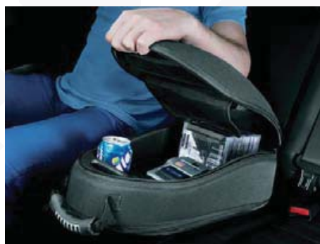
Tylny podłokietnik środkowy (77)

Dywaniki tekstylne, standardowe w kolorze grafitowym (61) , welurowe w kolorze czarnym (62) i gumowe (63) . Dywaniki tekstylne są ozdobione ściegiem z logo X-TRAIL, a także idealnie dopasowane do miejsca montażu (maty można z łatwością wyjąć do czyszczenia).