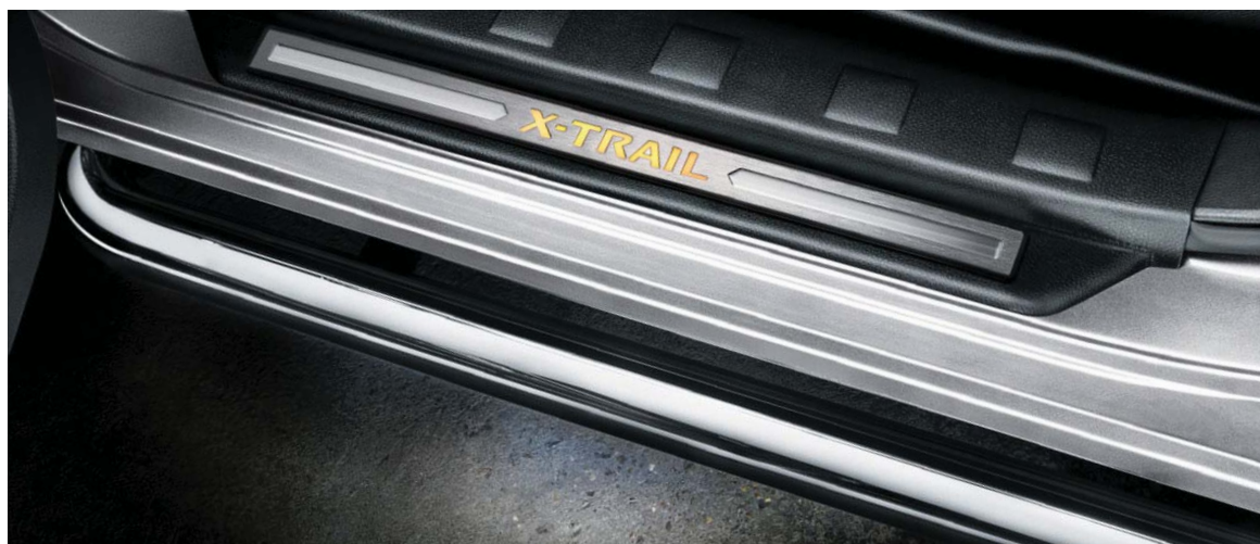
Nakładki ochronne progów iluminowane (19) i listwy boczne. Gdy otworzysz drzwi, logo X-TRAIL na nakładce progowej rozświetli się, a rurowy stopień boczny oświetli ziemię.