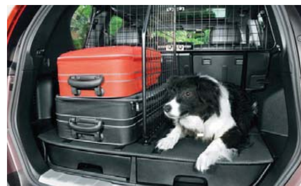
Kratka oddzielająca przestrzeń dla psa (64) i przegroda przestrzeni bagażowej (65) . Przegroda przestrzeni bagażowej wymaga zastosowania podwójnego dna i kratki przegrody.