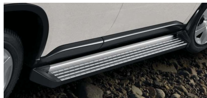
Boczny stopień (20) wykonany z utwardzonego aluminium o chropowatej, antypoślizgowej powierzchni.