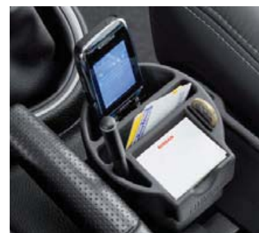
Okrągły uchwyt na telefon (79).