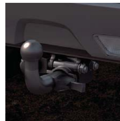
Rozłączalny zaczep holowniczy (63) zamontowany/zdjęty. Po zdjęciu zaczepu zakryj otwór w zderzaku zaślepką, by zapobiec przedostawaniu się tam błota i kurzu.