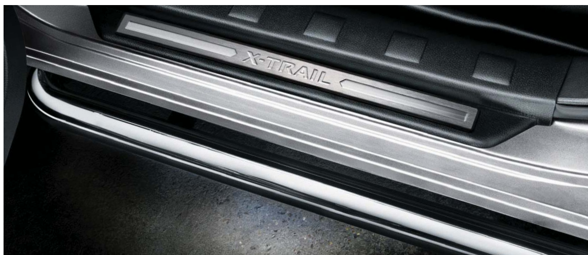
Nakładka ochronna progów (64) chronią X-TRAIL podczas wsiadania i wsiadania do samochodu.