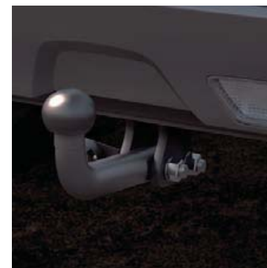
Zaczep holowniczy stały (62) .

Oprócz różnorodnych typów zaczepu holowniczego oferujemy pomysłowy i wygodny uchwyt na rowery montowany na zaczep, na którym można zamontować do dwóch rowerów. Ponieważ uchwyt osadzony jest nisko, załadunek i rozładunek jest bardzo prosty. Dostępny w 2 wersjach: kompatybilne z 7-stykowym złączem TEK lub z 13-stykowym złączem TEK.