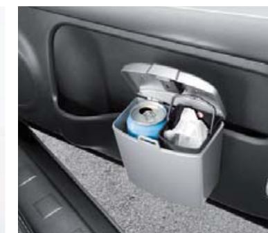
Pojemnik na śmieci (2 przedziały) (80).