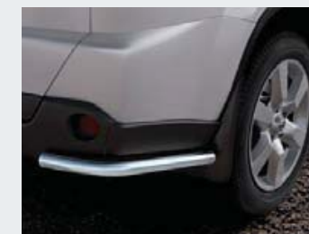
Narożne rury stylizujące (22) Zwiększają muskularny wygląd X-TRAILa zapewniając dodatkową ochronę.