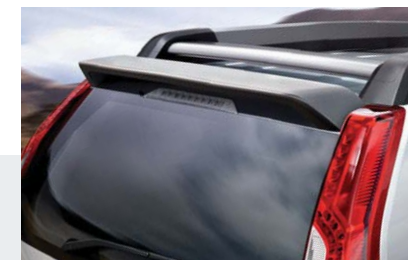
Spoiler dachowy (24) doda sportowy akcent do pojazdu.