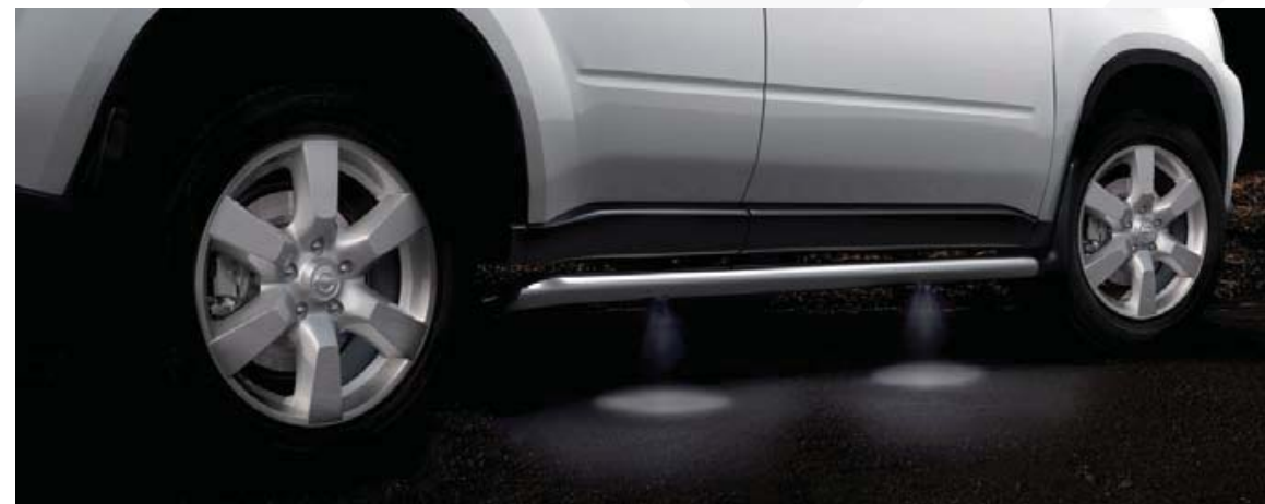
Iluminowane stopnie boczne (19) z wbudowanym oświetleniem ziemi.

Dodatkowe detale sprawiają, że siedzenie wewnątrz X-TRAIL jest jeszcze przyjemniejsze. Nakładka progowa i iluminowane stopnie boczne ciepło witają pasażerów.